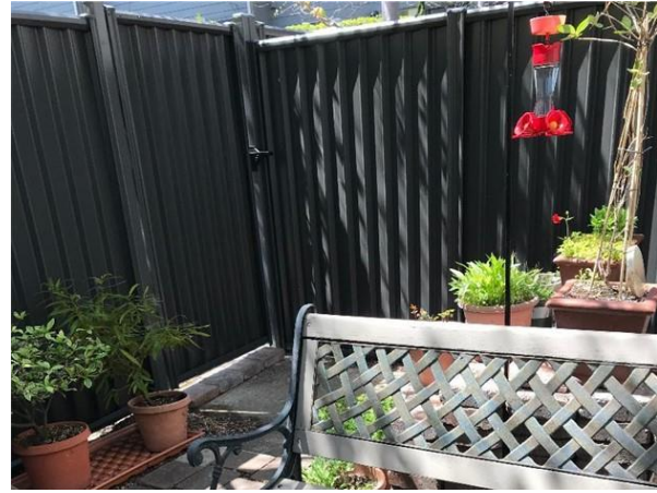
Cerca de privacidad de acero